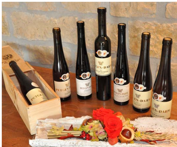
Gleich fünf Beerenauslesen und ein Eiswein wurden bei der Berliner Weintrophy mit Gold ausgezeichnet.